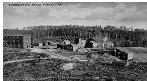
Timiskaming mines, Cobalt Ontario

Vader Purdy is al met pensioen; hij moest stoppen als mijnwerker in verband met een kwaal op de borst.