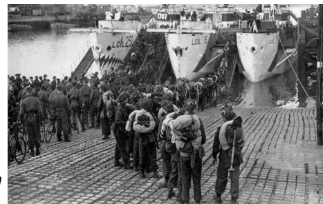
Militairen die ingescheept worden

Op 25 juni 1944 scheept hij in te Canada om op 3 juli 1944 in Engeland te arriveren. Op 4 Juli 1944 wordt hij toegevoegd aan het 3 e Canadian Armoured Corps Reinforcement Unit.