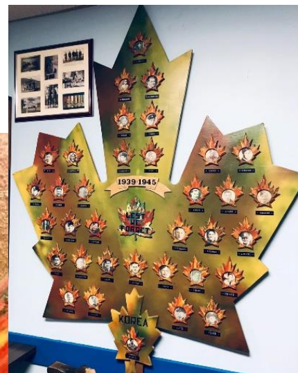
Royal Canadian Legion, Branch 44 Cobalt